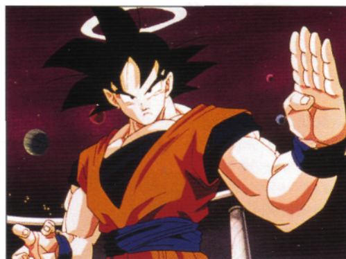
Son-Goku kämpft ab Februar auf der Kinoleinwand

können unter www.dragonballz-film.de abgerufen werden. Zudem feiert laut CTM die dritte Staffel der Animésaga „Dragonball GT“ mit 64 noch nie gezeigten Episoden voraussichtlich ab Juni/Juli Deutschlandpremiere auf RTL II. Zur Stärkung der Zuschauer hält Nestlé neben dem „Dragonball Z“-Wackelpudding einen Power-Snack bereit, und Eckes-Granini legt den Erfrischungs-