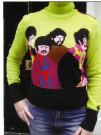
Pullover und Shirts von Jean-Charles de Castelbajac mit „Yellow Submarine“-Motiven

ketten und Versender geben. So könnten schon bald Hennes & Mauritz oder der Otto Versand ähnlich wie das US-Kaufhaus Bloomingdale's in New York exklusive Beatles-Kollektionen führen, die es nur bei ihnen gibt. Mit beiden Unternehmen ist V.I.P. bereits im Gespräch. Zurzeit gibt es nach Auskunft von Lou keine Lizenznehmer für Beatles-Produkte in Deutschland. Vorbilder jedoch gibt es genug: Von Beatles-Sammelfiguren über Porzellan, Papeterie- und Schülerartikel, Accessoires wie Krawatten, Halstücher, Socken und Boxershorts bis hin zu Handyschalen und Ka-