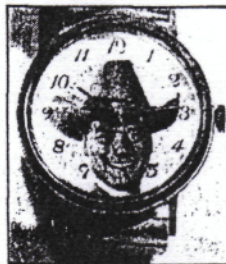
Die Dallas-Uhr mit dem grinsenden J. R. Ewing gibt es bisher nur in den Vereinigten Staaten

Für die Bundesrepublik, Österreich und die Schweiz waren die Lizenzrechte an Dallas noch nicht vergeben – er kaufte sie. Lou stieg vom Bank-aufs-Werbesgeschäft um und verkaufte innerhalb kurzer Zeit mehr als 250 000