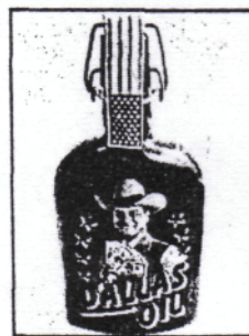
Ewing-Oil wird aus einer Mischung von Whisky, Curacao und einem Kräuterlikör hergestellt

Doch auch in den Markt der Dallas-Ignoranten und J. R.-Feinde will Lou nun einsteigen. Er verkauft einen Aufkleber. Aufschrift: „Dallas ist doof.“